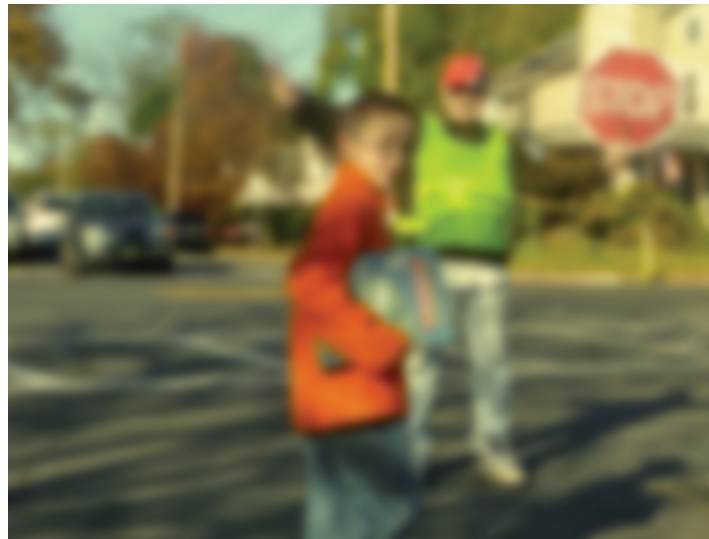
Visión borrosa causada por la catarata